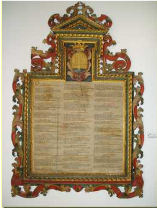
Tabla de los Diezmos de la segunda mitad del siglo XVII. Se encuentra en la Casa del Obispo de Cádiz, España.